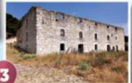
3 Fábrica del Macho